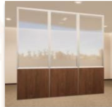
ITEM 03 DIVISÓRIA ½ MEIO CEGO E ½ VIDRO ÚNICO Qtde. máxima para adesão: 619 m 2 Preço Unitário: R$ 1.590,00