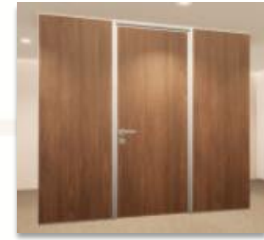
ITEM 04 PORTA DE GIRO DE MADEIRA C/BATENTES Qtde. máxima para adesão: 77 unid. Preço Unitário: R$ 4.210,00