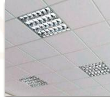
ITEM 11 LUMINÁRIA PARA FORRO MODULAR Qtde. máxima para adesão: 225 unid. Preço Unitário: R$ 690,00