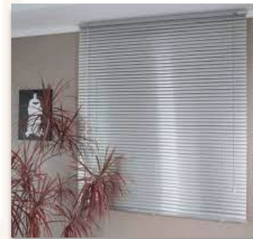
ITEM 07 PERSIANAS HORIZONTAIS Qtde. máxima para adesão: 246 m 2 Preço Unitário: R$ 495,00