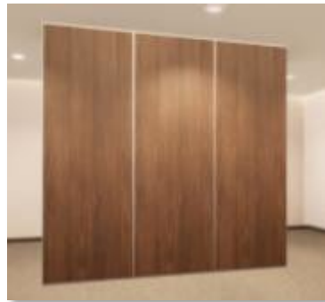
ITEM 01 DIVISÓRIA PISO TETO CEGO TOTAL Qtde. máxima para adesão: 512 m 2 Preço Unitário: R$ 1.110,00