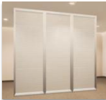
ITEM 05 DIVISÓRIA EM VIDRO DUPLO TOTAL Qtde. máxima para adesão: 93 m 2 Preço Unitário: R$ 2.350,00 *Persianas vendidas separadamente