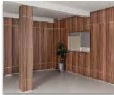
ITEM 09 REVESTIMENTO DE PAREDE Qtde. máxima para adesão: 186 m 2 Preço Unitário: R$ 745,00