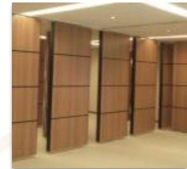
ITEM 08 DIVISORIA CEGA RETRÁTIL Qtde. máxima para adesão: 104 m 2 Preço Unitário: R$ 4.450,00