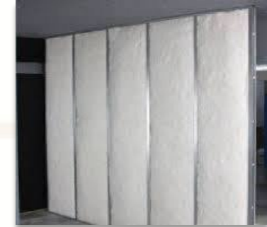
ITEM 12 MANTA PARA TRATAMENTO ACÚSTICO Qtde. máxima para adesão: 1.657 m 2 Preço Unitário: R$ 90,00