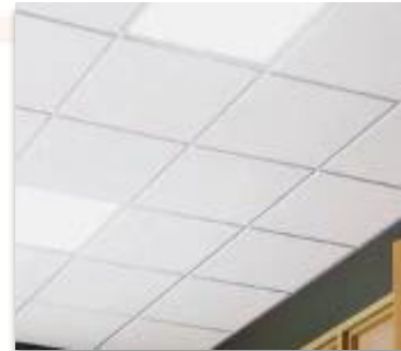
ITEM 10 FORRO MODULAR EM PLACAS Qtde. máxima para adesão: 2.722 m 2 Preço Unitário: R$ 290,00