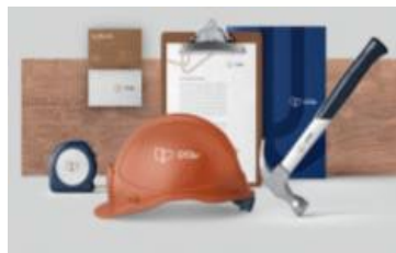
ITEM 13 SERVIÇO DE MONTAGEM OU DESMONTAGEM Qtde. máxima para adesão: 2.097 m 2 Preço Unitário: R$ 140,00