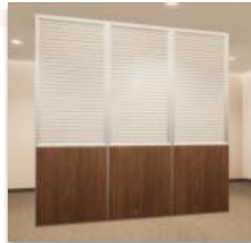
ITEM 02 DIVISÓRIA ½ MEIO CEGO E ½ VIDRO DUPLO Qtde. máxima para adesão: 249 m 2 Preço Unitário: R$ 1.890,00 *Persianas vendidas separadamente