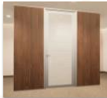
ITEM 06 PORTA DE GIRO DE VIDRO C/ REQUADRO Qtde. máxima para adesão: 18 unid. Preço Unitário: R$ 5.990,00