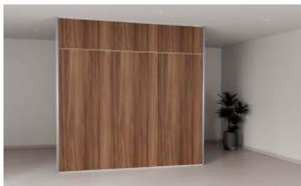
ITEM 04 DIVISÓRIA FIXA EM MADEIRA CONTRAPLACADO FORNECIMENTO E INSTALAÇÃO Quantidade registrada: 900 m 2 Preço unitário: R$ 1.110,00