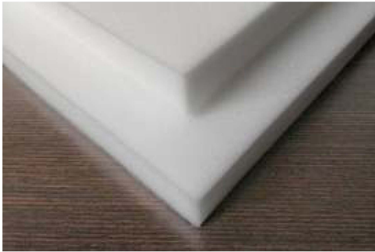
ITEM 06 ACESSÓRIO: LÃ PARA TRATAMENTO ACÚSTICO FORNECIMENTO E INSTALAÇÃO Quantidade registrada: 900 m 2 Preço unitário: R$ 130,00