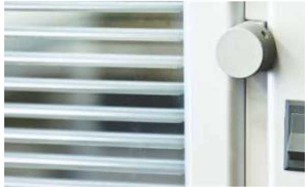
ITEM 07 ACESSÓRIO: PERSIANA DE ALUMÍNIO FORNECIMENTO E INSTALAÇÃO Quantidade registrada: 150 m 2 Preço unitário: R$ 475,00