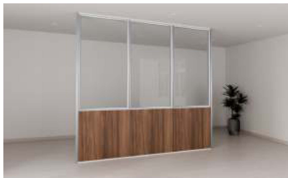
ITEM 02 DIVISÓRIA FIXA EM MADEIRA E VIDRO ÚNICO FORNECIMENTO E INSTALAÇÃO Quantidade registrada: 300 m 2 Preço unitário: R$ 1.460,00