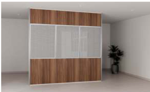
ITEM 01 DIVISÓRIA FIXA EM MADEIRA E VIDRO DUPLO FORNECIMENTO E INSTALAÇÃO Quantidade registrada: 150 m 2 Preço unitário: R$ 1.860,00 * Persiana entre vidros vendida separadamente