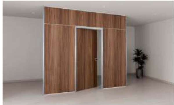
ITEM 09 PORTA DE GIRO COMPLETA EM MADEIRA FORNECIMENTO E INSTALAÇÃO Quantidade registrada: 60 un. Preço unitário: R$ 4.590,00