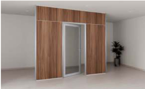
ITEM 08 PORTA DE GIRO COMPLETA EM VIDRO DUPLO FORNECIMENTO E INSTALAÇÃO Quantidade registrada: 05 un. Preço unitário: R$ 7.600,00