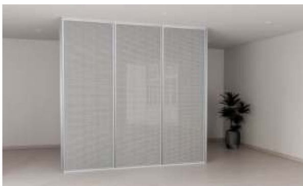
ITEM 03 DIVISÓRIA FIXA EM VIDRO DUPLO FORNECIMENTO E INSTALAÇÃO Quantidade registrada: 150 m 2 Preço unitário: R$ 2.390,00 * Persiana entre vidros vendida separadamente